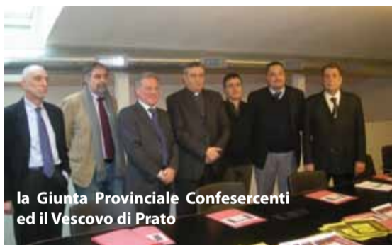
la Giunta Provinciale Confesercenti ed il Vescovo di Prato

con il sostegno di: CEI CONFERENZA EPISCOPALE ITALIANA