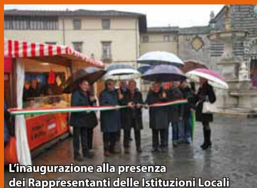
L'inaugurazione alla presenza dei Rappresentanti delle Istituzioni Locali